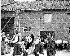
Fête des Moulins